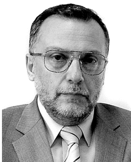
ლადო პაპავა, საქართველოს პარლამენტის წევრი, პროფესორი

„ბ.კ.“ რამდენად შეესაბამება აღნიშნულ დოკუმენტში წარმოდგენილი „მოსახლეობისა“ და „ეროვნული“ კეთილდღეობის, ასევე, ეროვნული უსაფრთხოების უზრუნველსაყოფად განსაზღვრული ორიენტირები საზოგადოებრივ დაკვეთას და არსებობს თუ არა რეალური რისკები ამ პროგრამის განხორციელებისათვის?